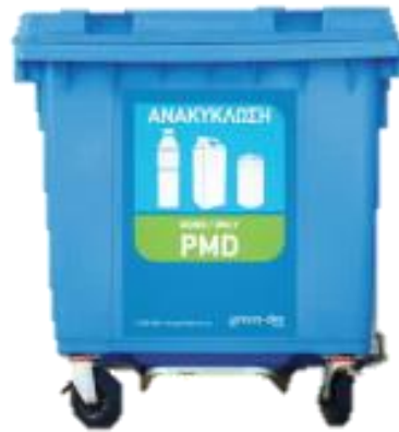
Μπλε Κάδος ΠΛΑΣΤΙΚΟ και ΑΛΟΥΜΙΝΙΟ