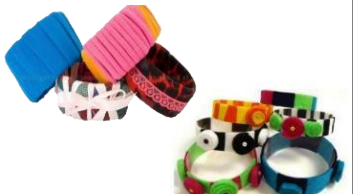
ΒΡΑΧΙΟΛΙΑ ΑΠΟ ΚΟΜΜΑΤΙΑ ΠΛΑΣΤΙΚΟΥ ΜΠΟΥΚΑΛΙΟΥ ΜΕ ΥΦΑΣΜΑΤΑ ΚΑΙ ΚΟΡΔΕΛΕΣ