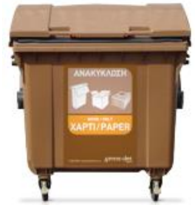
Καφέ Κάδος ΧΑΡΤΙ

Μπορείτε να παίξετε ένα παιχνίδι για την ανακύκλωση, πατώντας εδώ .