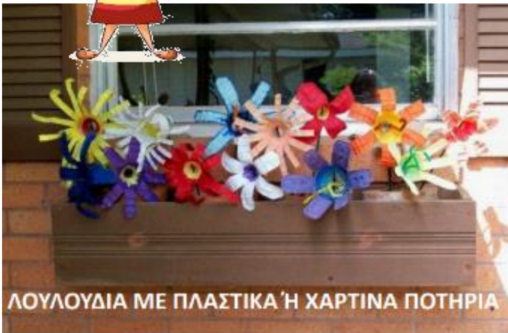
ΛΟΥΛΟΥΔΙΑ ΜΕ ΠΛΑΣΤΙΚΑ Ή ΧΑΡΤΙΝΑ ΠΟΤΗΡΙΑ