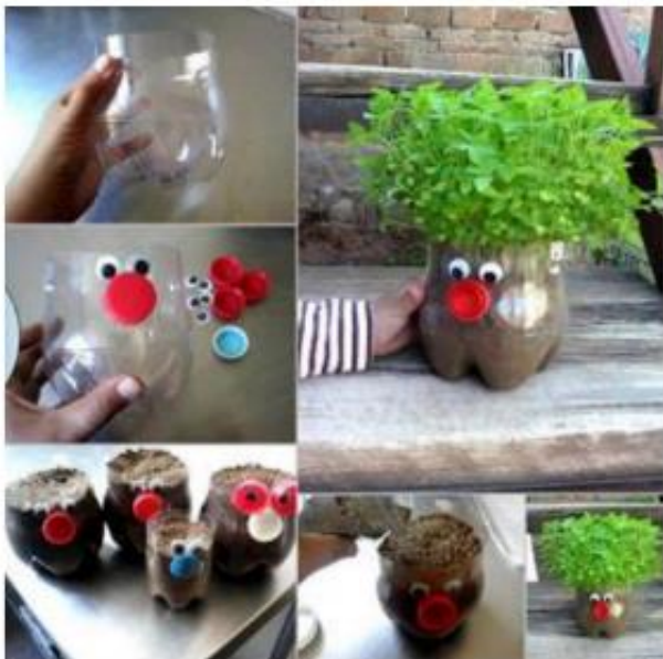
ΦΑΤΣΟΥΛΕΣ ΜΕ ΜΑΛΛΙΑ... ΠΟΥ ΜΕΓΑΛΩΝΟΥΝ