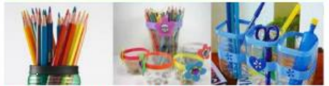
ΜΟΛΥΒΟΘΗΚΗ ΜΕ ΠΛΑΣΤΙΚΟ ΜΠΟΥΚΑΛΙ