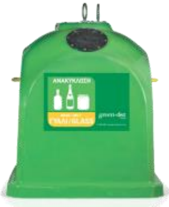
Πράσινος Κάδος ΓΥΑΛΙ

Έτσι, μάθατε για τους διαφορετικούς κάδους ανακύκλωσης.